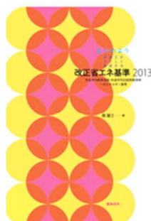
改正省エネルギー基準 2013