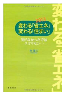
変わる「省エネ」 変わる「住まい」