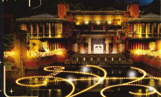
帝国ホテル中央玄関／帝都の貴婦人